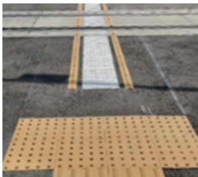
国土交通省の資料から

視覚障がい者の踏切事故撲滅に向けて、県は踏切内の点字ブロック設置を進めることになりました。